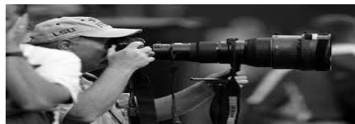
الشكل (٣) الكاميرا (سكاي هوك).