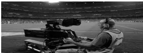
شكل (٢). الكاميرا (سكاي هوك).

من اللاعبين أو الجماهير ويعتبرون كبش الفداء لفشل الفرق وعليهم تقع مسؤولية الهزائم للفرق المتنافسة.