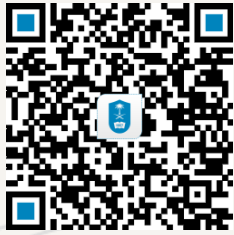
نموذج رفع شكوى للجنة الفرعية